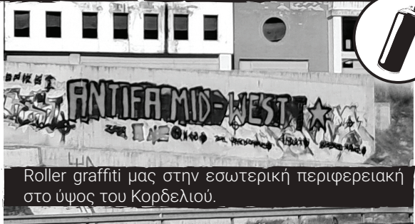
Roller graffiti μας στην εσωτερική περιφερειακή στο ύψος του Κορδελιού.