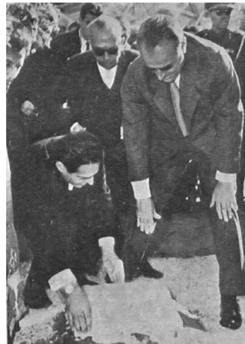
Ο Κωνσταντίνος Καραμανλής ως πρωθυπουργός θέτει το θεμέλιο λίθο του κτιριακού συγκροτήματος του πολυτεχνείου του Α.Π.Θ. στις 28 Οκτωβρίου του 1958. Αριστερά ο τότε πρόεδρος Γεώργιος Τσουτσουλόπουλος καθηγητής μαιευτικής και πίσω ο καθηγητής μετεωρολογίας Βασίλειος Κυριαζόπουλος. Σε αυτή την εικόνα πλέον όλα βγάζουν νόημα: πολιτικοί, γιατροί και μετεωρολόγοι. Σίγουρα αυτοί γνώριζαν πολύ καλά τι είναι το πανεπιστήμιο και για πιο λόγο το χτίζουν!

ναι καταδικασμένα να κυνηγούν την ουρά τους και να στροβιλίζονται γύρω από συντησιακά (δηλαδή αντεργατικά) αιτήματα, χωρίς να αντιλαμβάνονται την μηχανή του κιμά της καπιταλιστικής διατίμησης που τους ψιλοκόβει μεθοδικά. Η μηχανή θα συνεχίσει να δουλεύει και τα κινήματα θα συνεχίζουν να είναι συντησιακά, όσο δεν καταλαβαίνουμε ότι η εκπαιδευτική πολιτική του ελληνικού κράτους, είναι πολιτική αναπαραγωγής εργατικής δύναμης. Η σημασία της εργατικής δύναμης για τα αφεντικά δεν εξαντλείται στα προσόντα της. Αφορά, πάνω από όλα την συγκαταβατικότητα με την οποία αυτό το εμπόρευμα διατίθεται στην αγορά (εργασίας). Δωρεάν ή επί πληρωμή, η τριτοβάθμια εκπαίδευση και τα ιδρύματά της είναι μέρος της υλικής προετοιμασίας, του διαχωρισμού και της πειθάρχησης της εργατικής τάξης για τους σκοπούς του κρατικού συμφέροντος. Και τι μπορεί να είναι το κρατικό συμφέρον αν όχι το συμφέρον των αφεντικών;