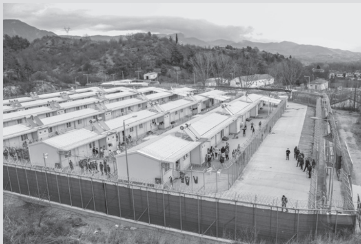
Κέντρο Κράτησης στο Παρανέστι Δράμας το 2015. Τώρα αν εσείς βρίσκετε διαφορές με τη "Δομή Φιλοξενίας" στο Κουτσόχερο, πάμε πάσο.

κοινωνίες. Μέσω αυτής της συνδιαλλαγής, τα κέντρα κράτησης είχαν κερδίσει την συμπάθεια τεχνικών εταιρειών, επιχειρήσεων σίτισης, κοινωνικών λειτουργών και ΜΚΟ.