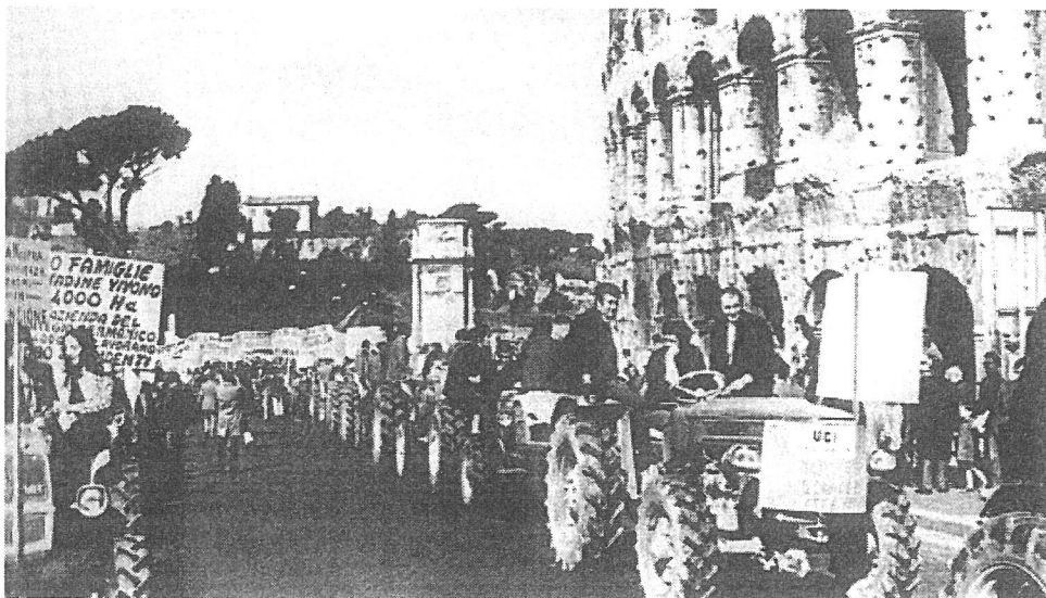
Ρώμη. Αγρότες με τα τρακτέρ τους και πεζοί διαδηλωτές με πανό συγκεντρώνονται μπροστά από το Κολοσσαίο. Είναι 7 Απριλίου του 1971 και η διαδήλωση ζητάει αύξηση των κρατικών επιδομάτων. Η πρώτη γενική απεργία της χρονιάς έλαβε χώρα σε εορταστική ατμόσφαιρα με τη συμμετοχή περίπου 11 εκατομμυρίων εργατών.