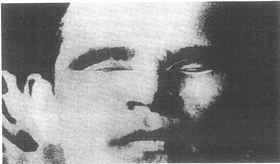
Αντόνιο Γκράμισι του Lucio Pozzi, 1977. AUT

Κι έτσι είναι που ξαναγυρνάμε στην έννοια που αποδώσαμε στον Μαρξ, την έννοια του κομμουνισμού ως το κόμμα το οποίο, αντί να φτιάξει το μοντέλο της μελλοντικής κοινωνίας, θα προμηθεύσει τα υλικά μέσα για την καταστροφή της τωρινής.