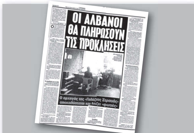
Ένα παράδειγμα του πως τα media αγκάλιασαν το πογκρόμ: η αγαπημένη εφημερίδα της ΕΥΠ, η Espresso, κυκλοφορεί με συνέντευξη της "Γαλάζιας Στρατιάς", παραμάγαζου της Χρυσής Αυγής, με τίτλο "Οι Αλβανοί θα πληρώσουν τις προκλήσεις".