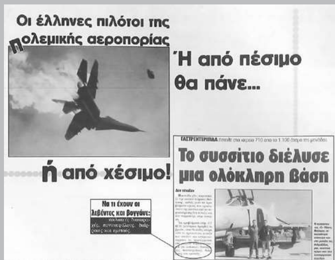
Αγνό, προβοκατόρικο, αντιπατριωτικό κράξιμο από τα 00’s. Μας λείπει όσο να πεις.