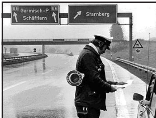
Το πρόβλημα: απαγόρευση κυκλοφορίας στη Δυτική Γερμανία. Μπάτσος ελέγχει τα χαρτιά κυκλοφορίας ενός οδηγού κατά την "Κυριακή χωρίς αμάξι". Ρε κάτι μας θυμίζει...

β) Το βασικό αγαθό που είχαν οι ΗΠΑ δεν ήταν το πετρέλαιο, αλλά το ναυτικό τους που εντωμεταξύ σουλάτσαρε σε όλο τον Περσικό Κόλπο για να μεταδώσει το μήνυμα της ειρήνης των λαών. Οπότε καθόλου τυχαία ο βασικός τρόπος που διασφάλιζαν τον εφοδιασμό τους ήταν - να το πούμε ευγενικά - η διπλωματία των όπλων.