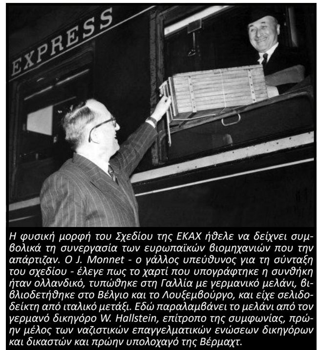
Η φυσική μορφή του Σχεδίου της ΕΚΑΧ ήθελε να δείχνει συμβολικά τη συνεργασία των ευρωπαϊκών βιομηχανιών που την απάρτιζαν. Ο J. Monnet - ο γάλλος υπεύθυνος για τη σύνταξη του σχεδίου - έλεγε πως το χαρτί που υπογράφηκε η συνθήκη ήταν ολλανδικό, τυπώθηκε στη Γαλλία με γερμανικό μελάνι, διβλιodeτήθηκε στο Βέλγιο και το Λουξεμβούργο, και είχε σελιδοδείκτη από ιταλικό μετάξι. Εδώ παραλαμβάνει το μελάνι από τον γερμανό δικηγόρο W. Hallstein, επίτροπο της συμφωνίας, πρώην μέλος των ναζιστικών επαγγελματικών ενώσεων δικηγόρων και δικαστών και πρώην υπολοχαγό της Βέρμαχτ.

"Η συνένωση των ευρωπαϊκών εθνών απαιτεί να εξαλειφθεί η μακράιωνη διαμάχη μεταξύ Γαλλίας και Γερμανίας. Η γαλλική κυβέρνηση προτείνει να τεθεί το σύνολο της γαλλογερμανικής παραγωγής άνθρακα και χάλυβα κάτω από μια κοινή Ανώτατη Αρχή. Η συγκέντρωση των παραγωγών άνθρακα και χάλυβα θα εξασφαλίσει αμέσως την εγκαθίδρυση κοινών βάσεων οικονομικής ανάπτυξης, πρώτο στάδιο της ευρωπαϊκής ομοσπονδίας, και θα αλλάξει το πεπρωμένο αυτών των περιοχών που από πολύ καιρό ασχολούνται με την κατασκευή όπλων για πόλεμους των οποίων υπήρξαν πάντα τα πρώτα θύματα." 6