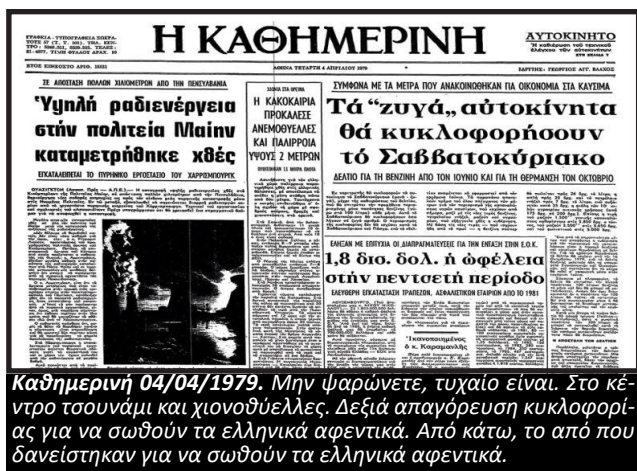
Καθημερινή 04/04/1979. Μην ψαρώνετε, τυχαίο είναι. Στο κέντρο τσουνάμι και χιονοθύελλες. Δεξιά απαγόρευση κυκλοφορίας για να σωθούν τα ελληνικά αφεντικά. Από κάτω, το από που δανείστηκαν για να σωθούν τα ελληνικά αφεντικά.

Όλα, λοιπόν, τα μέτρα περιορισμού της ζήτησης ήταν στην ουσία περιορισμός της κατανάλωσης μέσω πειθαρχησης της εργατικής τάξης. Το ελληνικό κράτος υιοθέτησε αντίστοιχα μέτρα περιορισμού της κατανάλωσης από τα ξενυχτάδικα μέχρι την κυκλοφορία αυτοκινήτων.