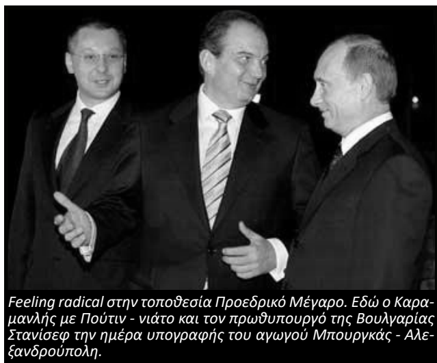
Feeling radical στην τοποθεσία Προεδρικό Μέγαρο. Εδώ ο Καραμανλής με Πούτιν - νιάτο και τον πρωθυπουργό της Βουλγαρίας Στανίσεφ την ημέρα υπογραφής του αγωγού Μπουργκάς - Αλεξανδρούπολη.

Όμως, όσον αφορά το ρωσικό αέριο, τα περισσότερα ευρωπαϊκά κράτη κάνουν τους άσχετους. Όσο η μεταστροφή στις ανανεώσιμες πηγές ενέργειας αφηνόταν στις καλένδες, πολλά κράτη έκαναν διμερείς συμφωνίες προμήθειας αερίου. Ή ακόμη καλύτερα, έκαναν σχέδια για να φτιάξουν μπουριά που περνούσαν από τα εδάφη τους. Η κατοχή ενός μπουριού δεν έκανε τα κράτη εξαρτημένα, αντίθετα τα έβαζε να έχουν συμφέροντα που ξεκινούσαν από το σημείο που έμπαινε το αέριο μέχρι το σημείο που κατέληγε. Τέτοιο μπουρί πήγε να γίνει και στο ελληνικό κράτος (αγωγός Μπουργκάς-Αλεξανδρούπολη σε συνεργασία με Ρωσία και Βουλγαρία), αλλά φάλιξε το 2010. Εν τέλει, τα ελληνικά συμφέροντα αρκέστηκαν στον αγωγό TAP και το αζέρικο αέριο.