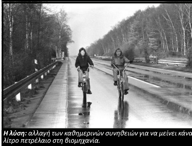
Η λύση: αλλαγή των καθημερινών συνηθειών για να μείνει κάνα λίτρο πετρέλαιο στη βιομηχανία.

Από την άλλη, τα ευρωπαϊκά κράτη - ο πραγματικός στόχος της πετρελαϊκής κρίσης - δεν ήταν σε τόσο βολική θέση. Ό,τι πετρέλαιο παίρνανε προερχόταν κυρίως από τα αραβικά κράτη. Τώρα όχι μόνο έπρεπε να πληρώνουν μέχρι και πενταπλάσια λεφτά για να το πάρουν, αλλά και δεν ήταν σίγουρο το πόσο θα πάρουν 10 . Σε τόσο δύσκολους καιρούς, τα ευρωπαϊκά κράτη απάντησαν ενωτικά. Πλάκα κάνουμε, το κάθε κράτος κοίταξε την πάρτη του. Η πετρελαϊκή κρίση του 1973 αποδείχθηκε οδυνηρά αποδιοργανωτική. Κάθε κράτος φρόντιζε να διαπραγματευτεί με συγκεκριμένους πετρελαιοπαραγωγούς εις βάρος άλλων ευρωπαϊκών κρατών. Το ελληνικό εφοπλιστικό κεφάλαιο για παράδειγμα, εκμεταλλεζόμενο τις υψηλές τιμές έκανε λαθρεμπόριο πετρελαίου, διπλασίασε το στόλο του και υποστήριζε με επενδύσεις τα αναπτυξιακά σχέδια του (εκτός ΕΟΚ ακόμη) ελληνικού κράτους. Το πιο εντυπωσιακό ήταν, πως κράτη όπως η Γαλλία, η Δυτική Γερμανία και η Αγγλία, ήταν πρόθυμα να συμμορφωθούν με το εμπάργκο σε κράτη όπως η Ολλανδία με αντάλλαγμα την προμήθεια πετρελαίου. Κάτι που με τη σειρά του έκανε την Ολλανδία να απειλεί με περιορισμό προμήθειας φυσικού αερίου τη Γαλλία και την Αγγλία. Απ' την άλλη, η Δυτική Γερμανία των τεράστιων εμπορικών πλεονασμάτων είχε την ευχέρεια να φορτώνει χωρίς φόβο τους προϋπολογισμούς της για να αντέξει στο ακριβό πετρέλαιο 11 . Χρειάστηκε ένας μήνας προτού τα